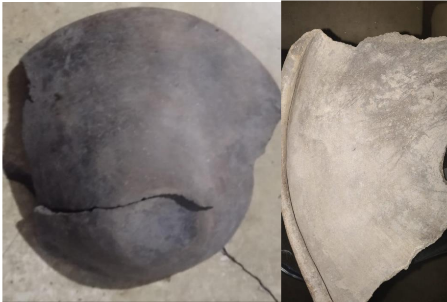
Foto 3. Fragmento cerámico. (Fuente: radicado 2026184200037812).