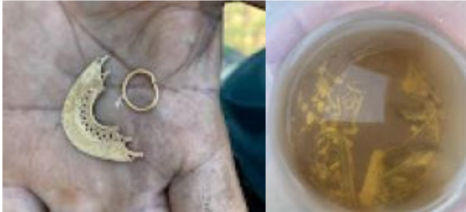
Foto 1. Presuntas piezas de orfebrería prehispánica. (Fuente: radicado 2026184200038342).